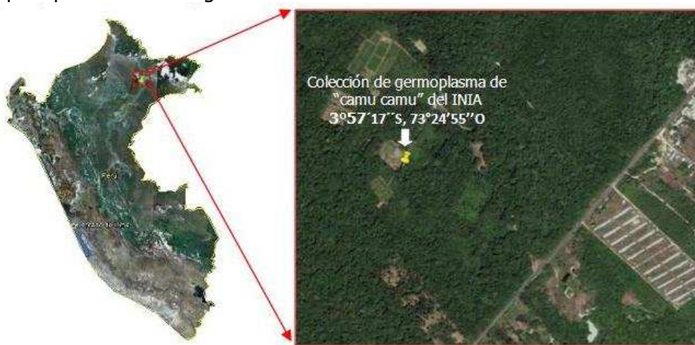
Figura 1. Ubicación de la Colección de Germoplasma de "camu camu" del INIA. Lugar donde se colectaron las hojas del "camu camu" para purificar el ADN genómico. Imagen tomada de Google Earth.

Las muestras biológicas (hojas tiernas) de "camu camu" fueron obtenidas de la colección de germoplasma de "camu camu", de la estación experimental "El Dorado" del Instituto Nacional de Innovación Agraria (INIA), ubicado a la altura del km 25½ de la carretera Iquitos-Nauta (Figura 1). Las muestras obtenidas fueron transportadas en condiciones de refrigeración al Laboratorio de Biotecnología del Centro de Investigación de Recursos Naturales (CIRNA) de la Universidad Nacional de la Amazonía Peruana, donde se almacenaron a -20 °C, las que posteriormente fueron procesadas para purificar el ADN genómico.