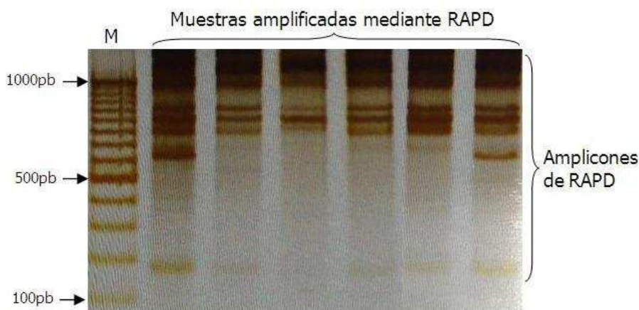
Figura 5. Gel de poliacrilamida al 8% con amplicones generados mediante RAPD a partir del ADN genómico purificado de Myrciaria dubia "camu camu". Las bandas de ADN fueron reveladas por tinción argéntica. La electroforesis se realizó a 100V por 2 horas en buffer TBE 1X. M: Marcador de peso molecular (100bp DNA Ladder).

Finalmente, podemos manifestar que el ADN purificado no contiene inhibidores de la ADN polimerasa taq. Lo indicado se sustenta en el hecho que se ha logrado sintetizar amplicones de diversos tamaños con el RAPD (Figura 5). Los amplicones de RAPD presentaron tamaños de más de 100pb a >1000pb. También, es notorio que existen bandas monomórficas y polimórficas, en consecuencia, el cebador empleado podría ser útil para estudios de diversidad genética de la especie mediante RAPD.