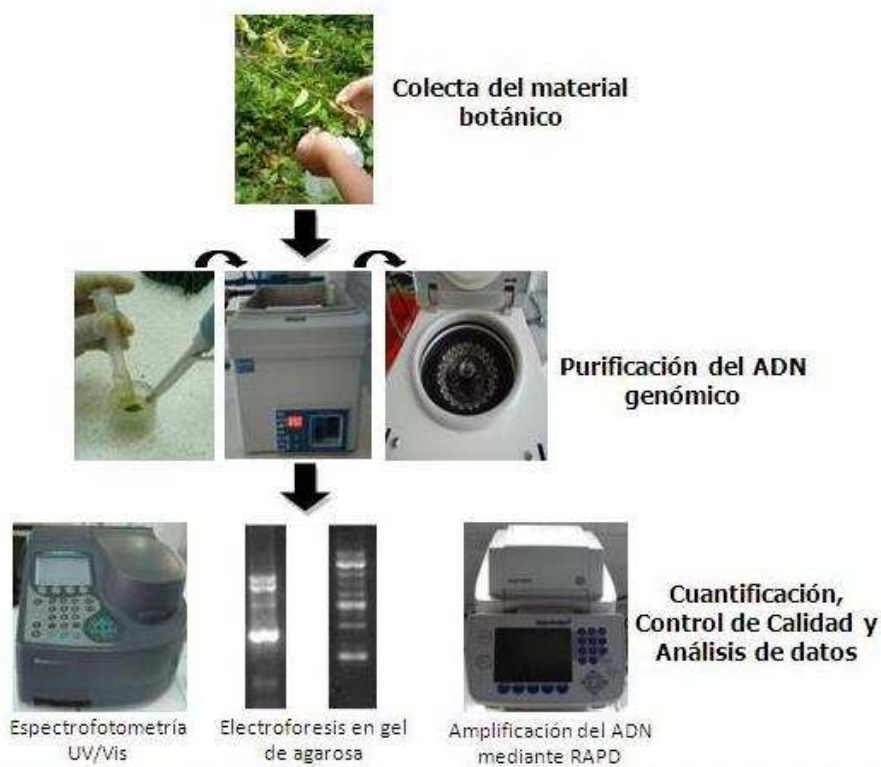
Figura 2. Flujograma del protocolo empleado para aislar el ADN genómico a partir de hojas de Myrciaria dubia "camu camu"

El flujograma del procedimiento se muestra en la Figura 2.